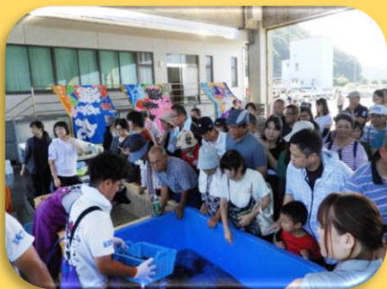
伊勢えび・活魚 特産品販売