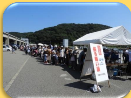
振る舞い 海鮮巻き・すり身鍋