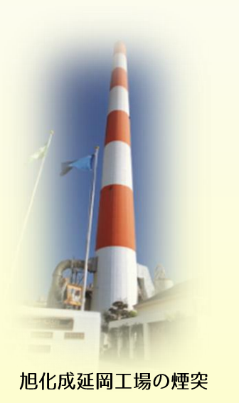
旭化成延岡工場の煙突