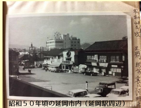
昭和50年頃の延岡市内(延岡駅周辺)