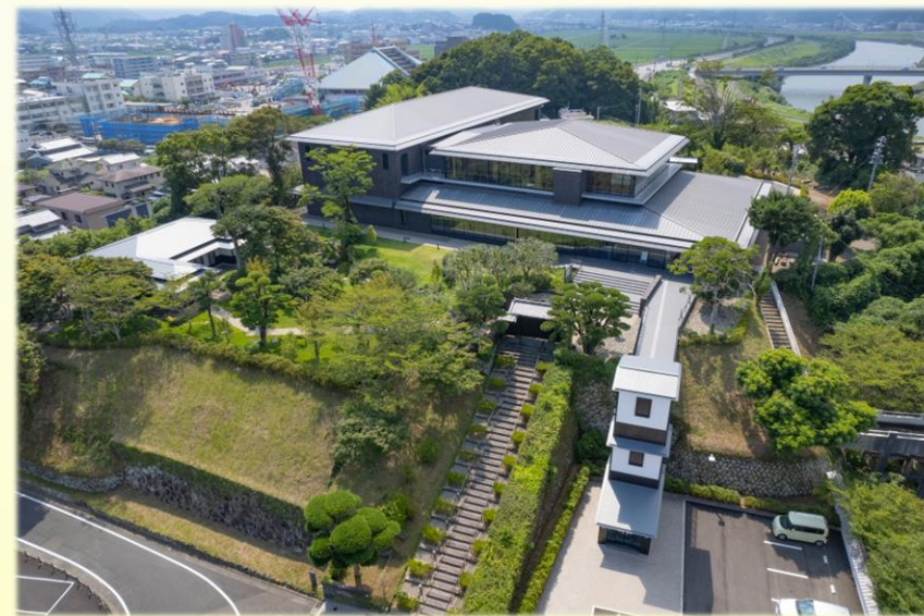
本年9月23日にオープンする「延岡城・内藤記念博物館」