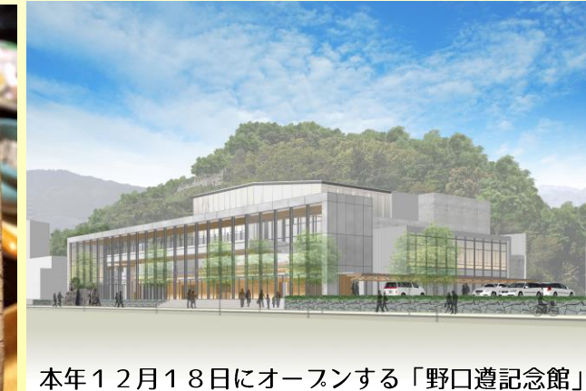
本年12月18日にオープンする「野口遵記念館」