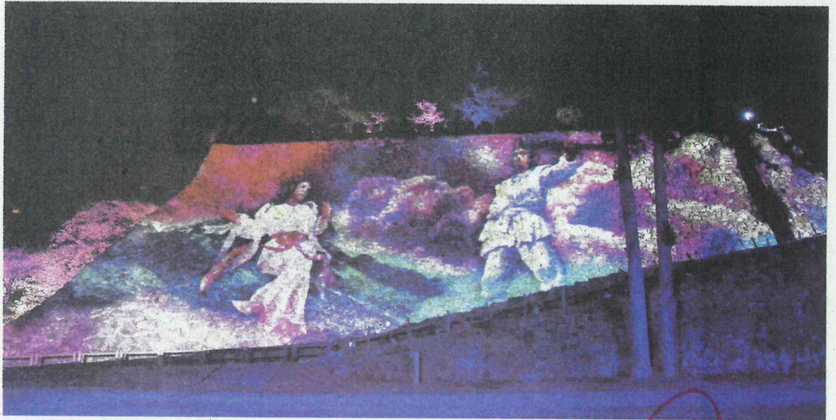
千人殺しの石垣の企画を使って行われるプロジェクト「インディアン」(延岡市城山公園)