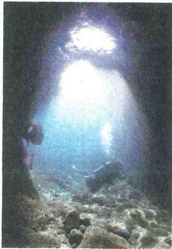
青の洞窟（水深5メートル）