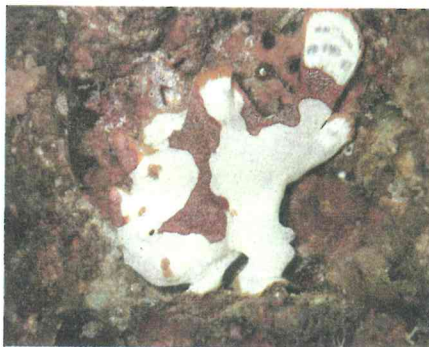
クマドリカエルアンコウ（水深13メートル）