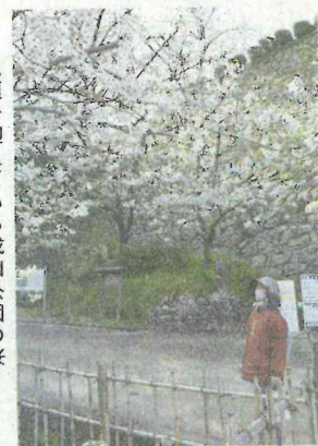
平年より早く開花し

北の各地で見頃を迎えている。多くの桜スポットで満開となり、散策などをして春の訪れを楽しむ人たちの姿