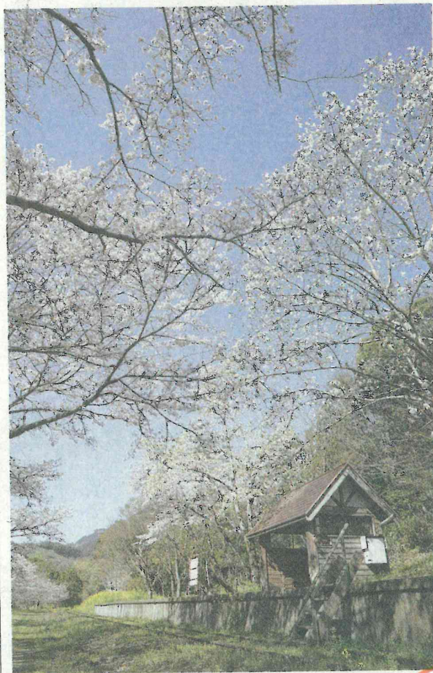
旧高千穂鉄道深角駅の桜。ホームは今も昔のまま (23日)