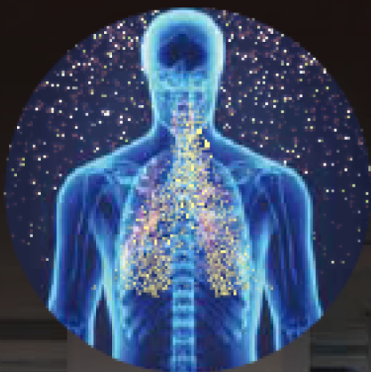
浮遊菌・ウイルスを除菌

空気中に浮遊する菌・ウイルス花粉などアレルギーをオゾンと紫外線が不活化 さらに ドアノブや床・家具などに付着する菌やウイルスなども除菌が可能