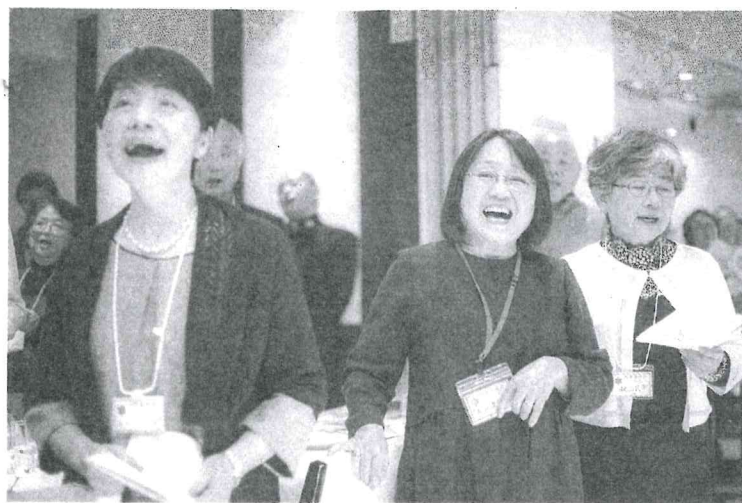
歴史は香る……懐かしい校歌を大合唱