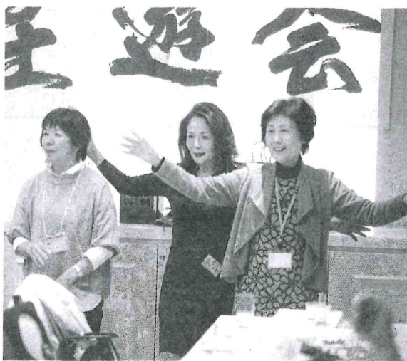
最後は全員が輪になってばんば踊り