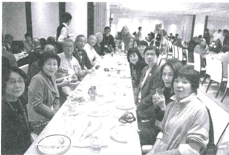
卒業生ごとにテーブルに座り、1年ぶりの再会を喜び、旧交を温める