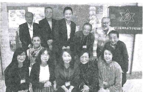
還暦を迎えた13回生の皆さん