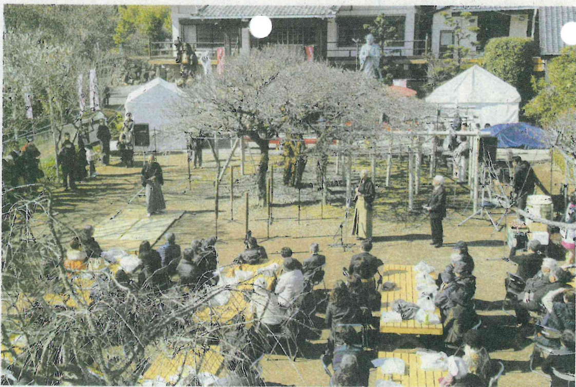
本東寺の慧日梅観梅会(10日)

延岡花物語の開催期 は2月1日から4月 日。今後は、今月23、24 日に五ヶ瀬川堤防でこ はなウォーク、3月22 日から4月7日まで延岡 跡城山公園でワイワ 花骨物語、同月6日に ワイワイグルメ博な が開かれる。