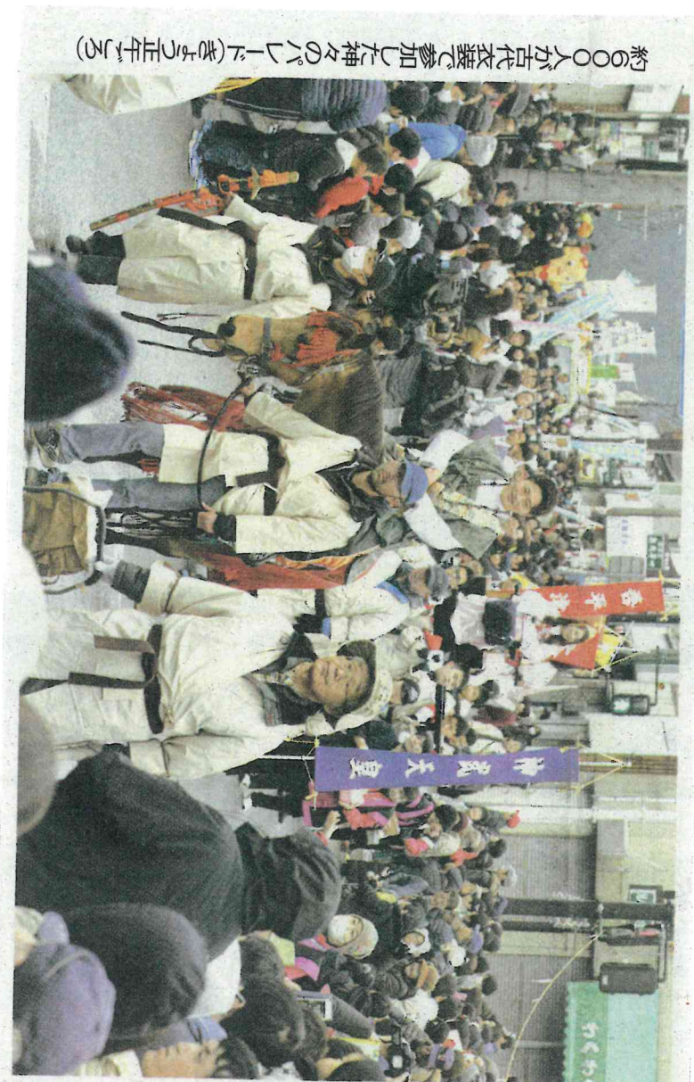
約700人が古代衣装で参加した神々のパレード(まじりまつり)

町中心部のメイン会場 では、バナーや大釜で作 る名物の「建國」(建)の 振る舞い、職場グループ 對抗の闘引き(綱引き)大 あふれた。