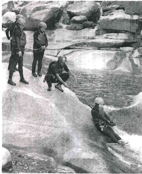
表面が滑らかな花こう岩はまるで天然の滑り台