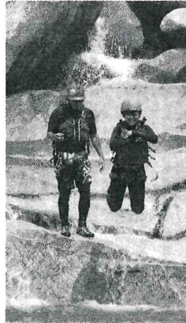
大小の花こう岩が点在するコースには飛び込みが楽しめる場所も