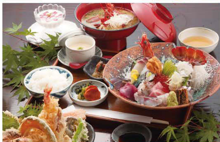
魚料理○海 MARUKAI 伊勢えび御膳 8,880円(税込)※季節により内容が変更します。