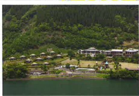
石岐レイクランド