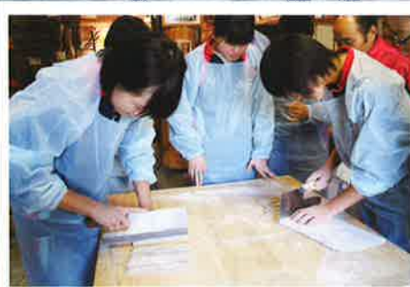
そば打ち体験・昼食